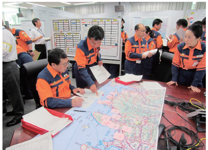
参謀班による被害状況の把握、方針の決定状況

応急対策室では、職員のさらなる災害対応能力向上と各班の業務の連携強化のために図上訓練を実施し、災害発生時の対応に万全を期することとします。